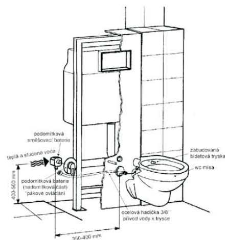
Montážní schéma pro napojení závěsného wc+bidetu 2v1 na teplou předmíchanou vodu s ovládním podomítkovou pákovou baterií a skrytým napojením přívodu vody k trysce

Potřebujete: WC+BIDET 2v1 závěsný nosný modul se splachovacím systémem podomítkovou směšovací baterii pro trysku (pákovou či termostatickou) ocelovou hadičku pro napojení vody k trysce